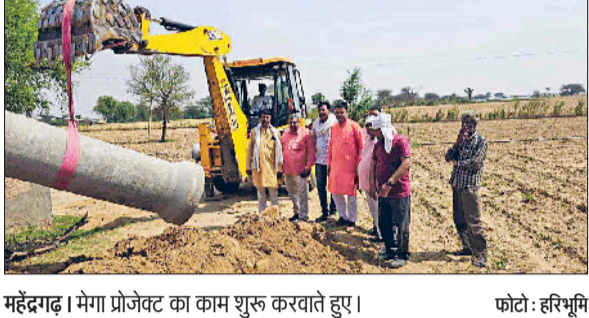
महेन्द्रगढ़। मेगा प्रोजेक्ट का काम शुरू करवाते हुए।

अवैध शराब के साथ एक पकड़ा, 288 पत्ते बरामद नारनौल। सीआईए पुलिस ने निजामपुर क्षेत्र में गांव मौखुता से कच्चे रास्ते नाकाबंदी के दौरान एक आरोपित को गिरफ्तार कर अवैध शराब बरामद की है। पुलिस ने 288 पत्ते देशी शराब बरामद की है। पुलिस ने अवैध शराब को जल कर आरोपित के खिलाफ थाना निजामपुर में आबकारी अधिनियम के तहत मामला दर्ज कर कार्टवाइ शुरू कर दी।