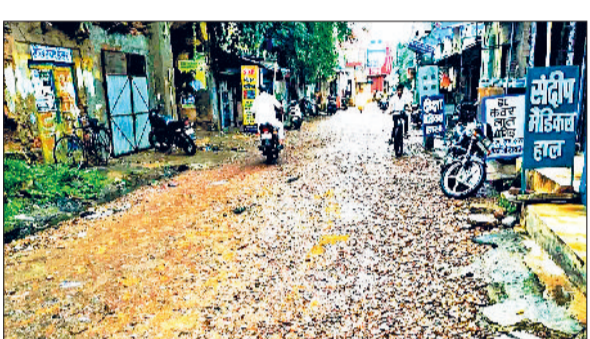
महेंद्रगढ़। सड़क निर्माण के लिए बिछाई गई रोड़ियां।

शहर की 11 हट्टा बाजार के अतिक्रमण के खिलाफ नपा बड़ा कदम उठा सकती है। नपा की ओर से बाजार में मुनादी करवाकर दुकानदारों को स्वयं अतिक्रमण हटाने की चेतावनी दी है। सोमवार को नपा पुलिस बल के साथ बाजार के अतिक्रमण के खिलाफ सख्त कार्रवाई करेगी।