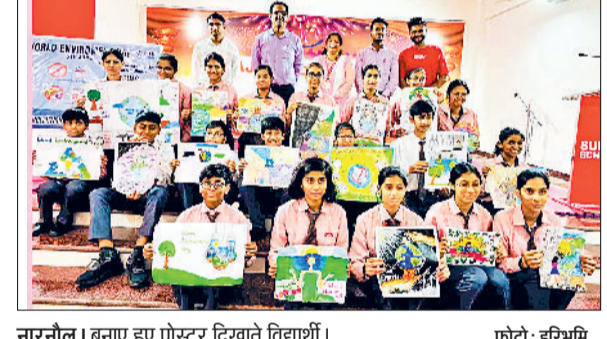
नारनौल। बनाए हुए पोस्टर दिखाते विद्यार्थी।