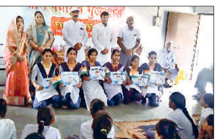
मंडी अटेली। सम्मान समारोह में मेधावी बच्चों को प्रशंसा पत्र देते हुए।