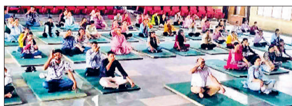
महेन्द्रगढ़। आडिटोरियम हॉल में योग करते हुए।