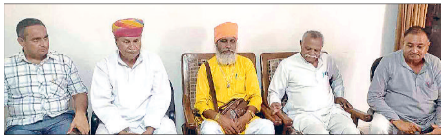
महेन्द्रगढ़। रेस्ट हाउस में प्रेस वार्ता करते हुए।

इस प्रकार उन्होंने युगों पुरानी घटना का जिक्र करके अप्रत्यक्ष रूप से राजपूत समाज को आतंकवादियों की संज्ञा दे डाली, जबकि शास्त्रों में उस युग के दौरान कोई आतंकवादी