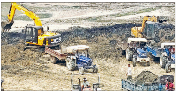
मंडी अटेली। गांव के जोहड़ की छंटाई करती मशीनें।

बताया कि करीब पांच एकड़ में फैले जोहड़ का पहले पानी, अब उसमें जमी गंदी गद गद को युद्ध स्तर पर पोपलेंड, जेसीबी व ट्रैक्टरों की सहायता से निकाला जा रहा है। गांव के जोहड़ की छंटाई के लिए