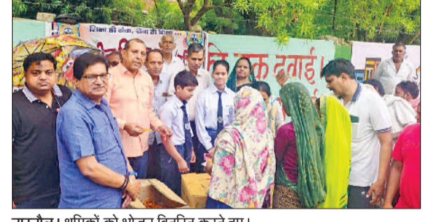
नारनौल। श्रमिकों को भोजन वितरित करते हुए।