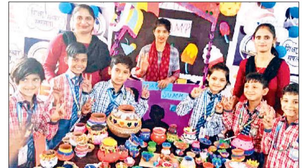
महेंद्रगढ़। बच्चों द्वारा बनाए गए मिट्टी के बर्तन व अन्य सामान।

शुरू कर दिया गया है। वहीं पिछले सप्ताह ठेकेदार की ओर से मुख्य बाजार की सड़क का भी निर्माण कार्य शुरू किया गया था, लेकिन नपा चेयरमैन व दुकानदारों ने ठेकेदार पर घंटिया साग्रणी का उपयोग करने का आरोप लगाते हुए निर्माण कार्य रूकवा दिया गया था। यह मार्ग दो महाविद्यालय, मांडल संस्कृतिक स्कूल, 148-बी से जोड़ता है। इसके अलावा यह मार्ग 50 से अधिक गांवों को शहर से जोड़ता है। दिनभर इस मार्ग से हजारों की